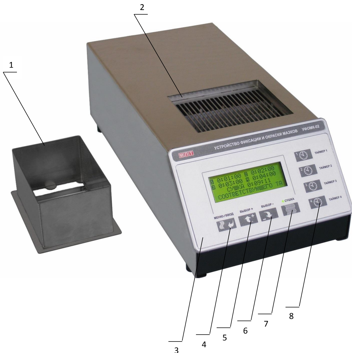
Рис. 1. Внешний вид устройства УФОМК-02.

5.6. В устройстве обеспечивается возможность использования цельнометаллических штативов по ТУ 9443-001-95221815-2009, ТУ 9443-002-95221815-2012 при применении специальной подставки для штативов МЛБА.02.24.00, показана на рис. 1.